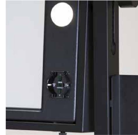
Presa di corrente universale 110-240V

La postazione trucco su ruote L400 coniuga spazio, immagine e professionalità. È dotata di 6 luci I-light in cornice e presa universale. Ottima soluzione per negozi e punti vendita. Nella versione a doppio specchio (fronte e retro) è ideale per le accademie di makeup e hair-styling.