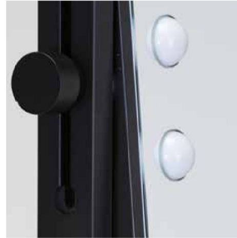
Ampio specchio con luci I-light incastonate