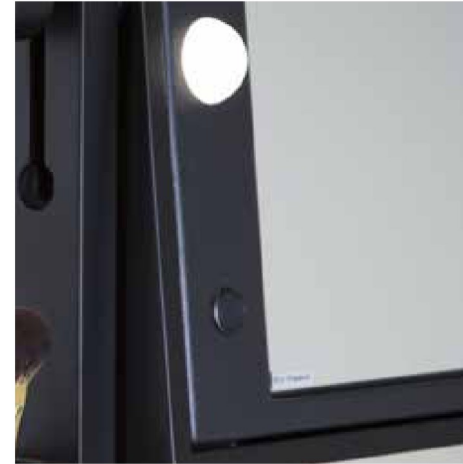
Luci I-light Pulsante dimmer per regolazione dell'intensità luminosa