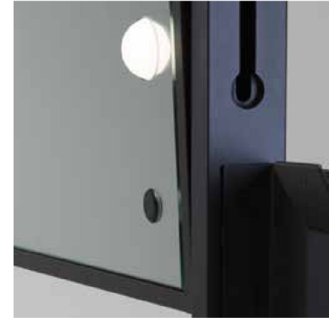
Pulsante dimmer per regolazione dell'intensità luminosa

La postazione trucco su ruote L400 Full Mirror è dotata di 4 ampi cassetti laterali, 6 luci I-light incastonate nello specchio. È un'ottima soluzione per l'arredo di corner make-up in negozi e punti vendita. Nella versione a doppio specchio (fronte e retro) è ideale per le accademie trucco.