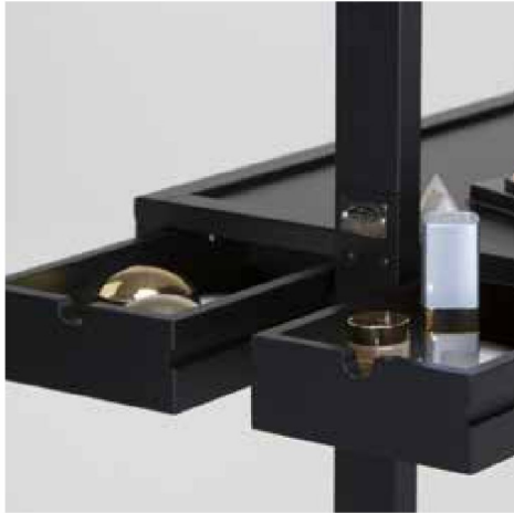
Piano di appoggio con 4 comodi cassetti ad apertura laterale