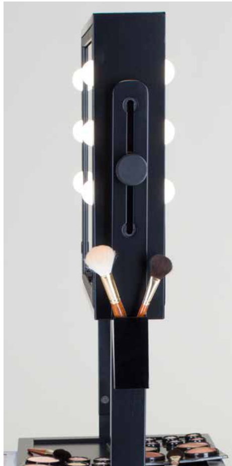
L400X2-FO OPZIONE DOPPIO SPECCHIO

La versione con specchio illuminato su entrambi i lati è ideale per le scuole trucco: fino a 4 allievi possono lavorare in contemporanea su una sola postazione.