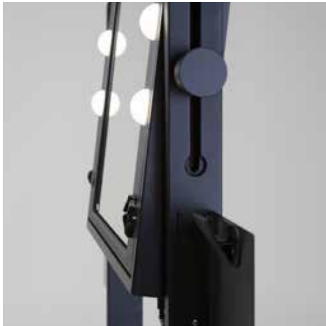
POMELLO per bloccare inclinazione e altezza specchio